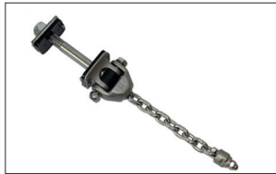
EME-Z-0461 bis -0467